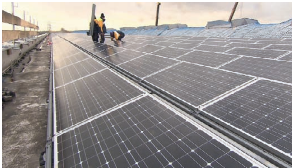
Die neue Solaranlage von SMS Meer hat eine Nennleistung von 475 kWp.

Tel.: 021 61-49 53 95 oder 0177 / 4 95 39 50 kontakt@focus-s.de, www.focus-s.de